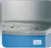
Grille tout inox pour carafes Stainless steel grid for water jugs