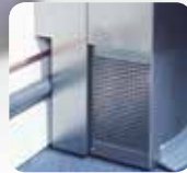
Découpe au dos de la fontaine pour le passage des tuyaux Cutting down to run tubings