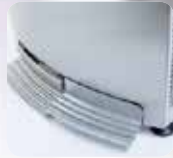
Distribution de l'eau à pédales Water distribution by pedals

A successful design that hides the water inlets pipings and provides total support against the wall. With its pedals distribution and stainless steel grid, the R2000 seduces by its finishes.