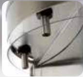
Sorties d'eau amovibles en inox avec protection sanitaire Removable stainless steel water outlets with sanitary protection